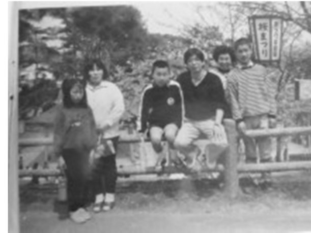
この記念写真 愛宕山公園の散策風景です。

この穏やかな表情のとおり、ことばの不自由な方々を見守って下さいました。 平田小学校の教諭時代から、その人柄から多くの人から慕われ、尊敬されていました。