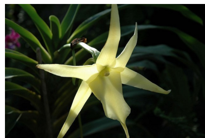
アングレカムの花