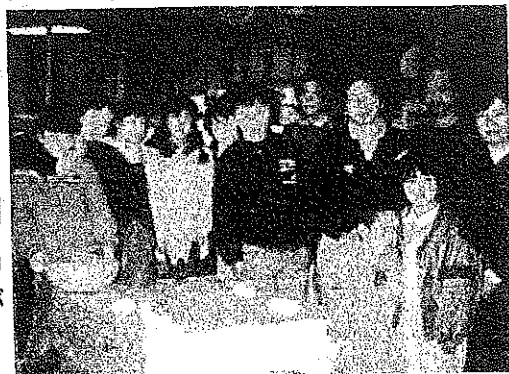
みんな勢揃い（寄稿文に登場するメンバー）